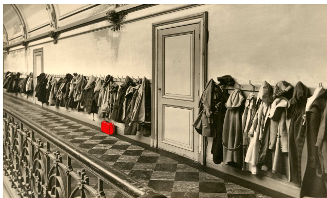
FREINETSCHOOl DE HARP